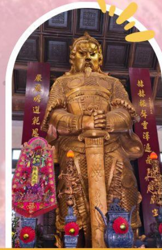
วัดแซกง ขอพรโชคลาก การเงิน และธุรกิจ