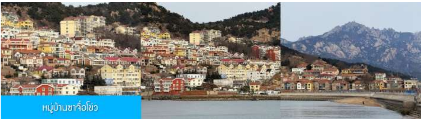
หมู่บ้านซาจื่อโ้ว

เที่ยง รับประทานอาหารกลางวัน ณ ภัตตาคาร (มื้อที่ 7)