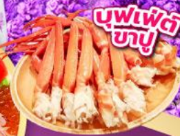
บุฟเฟ่ต์ ขาปู