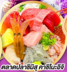
ตลาดปลาฮิมิสึ คาชิโนะอิชิ