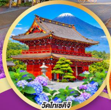
วัดโทเซคิจิ