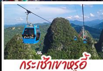
กระเช้าเขาหุ่ย