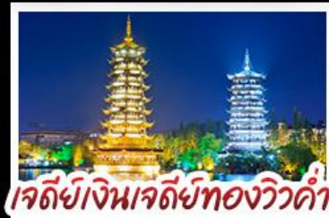
เจดีย์เงินเจดีย์ทองวิวคำ

เมนูพิเศษ บุฟเฟ่ต์ชาบูซีฟู้ด ปลาอบเบียร์ ฝ็อกคริสตล สุกี้หัด