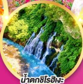
น้ำตกชิโรฮิเมะ