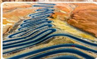
ถนนผานหลงกู่ต้าอว