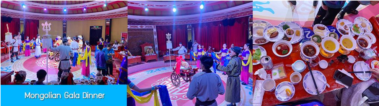
Mongolian Gala Dinner