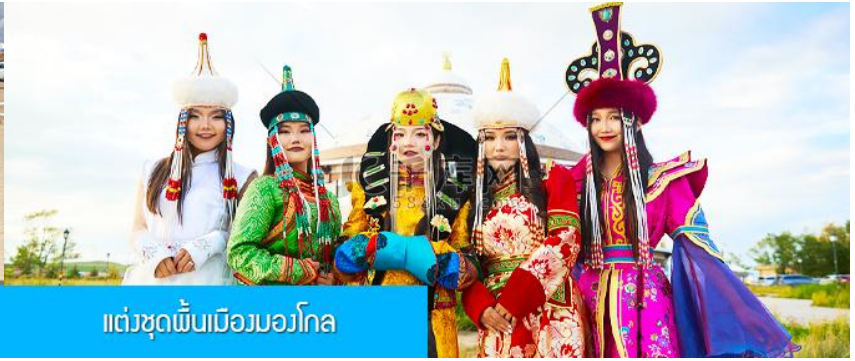
แต่งชุดพื้นเมืองมองโกล