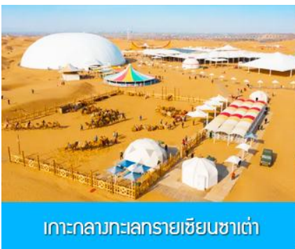
เกาะกลางทะเลทรายเซียนซาเต๋า