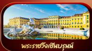
พระราชวังเซินบรูน์