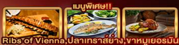
Ribs of Vienna, ปลาเทราสย่าง, ขาหมูเยอรมัน

Zugspitze Munich Salzburg Hallstatt Bratislava