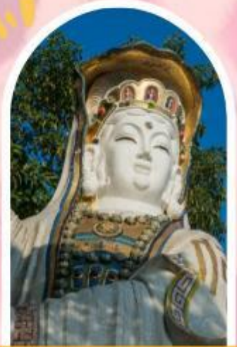
ริพลัสเบย์ รับพลังงานดี เสริมพลังดวงจัญ