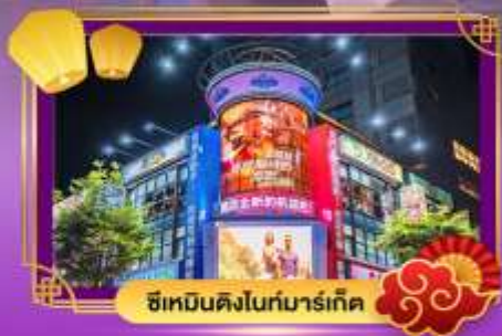
ซีเหมินดิงไนท์มาร์เก็ต