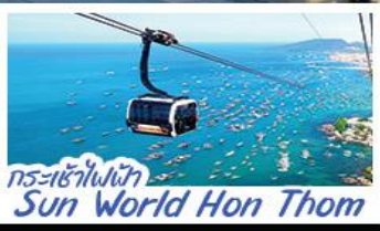
กระเช้าไฟฟ้า Sun World Hon Thom