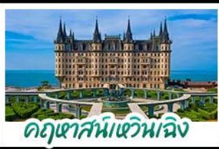
ฤดูหาสมบัติหวิงเจิง

เมืองเก่าชิงเต่า - ฤดูหาสมบัติหวิงเจิง เบียร์ชิงเต่า + อาหารทะเล สตรีทอาร์ต สตูดิโอจิบลิ