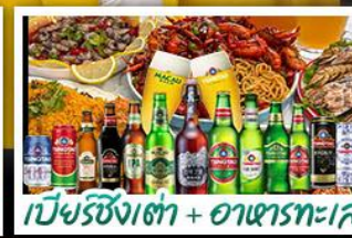
เบียร์ชิงเต่า + อาหารทะเล