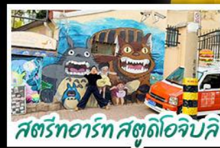
สตรีทอาร์ต สตูดิโอจิบลิ