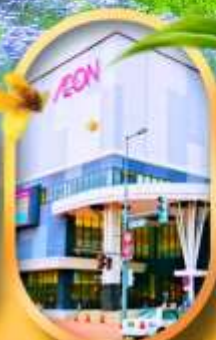
อออนมอลล์