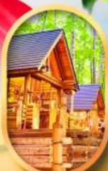
บึงเทิลเกอเรส