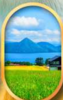
ทะเลสาบโทยะ