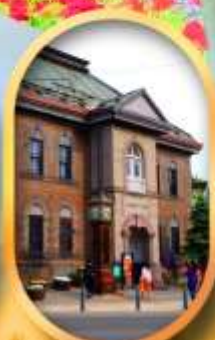
พิพิธภัณฑ์กล่องดนตรี