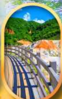
โนโบริเบ็ตสึ