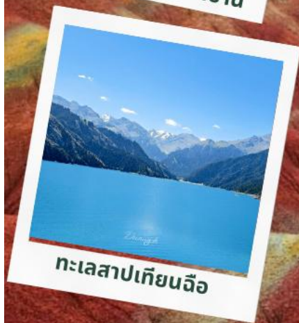
ทะเลสาปเทียนฉือ