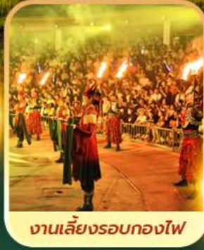
งานเลี้ยงรอบกองไฟ