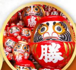
วัดคัตสึโฮจิ (วัดดาร์มะ)

ชมความงามของกำแพงหิมะ เส้นทางสายอัลไพน์ทาทยามา (JAPAN ALPS SNOW WALL)