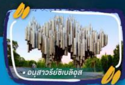
• อนุสาวรีย์ซิมลิส