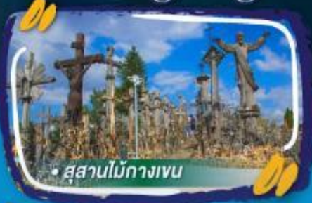
• สุสานไม้กางเขน