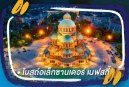
• โบสถ์อเล็กซานเดอร์ เนฟสกี