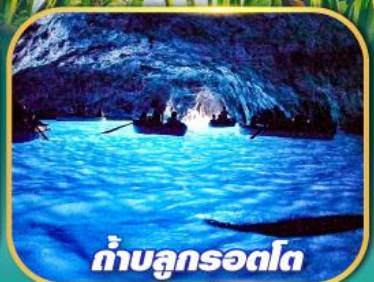
ถ้ำลูกเรือตก