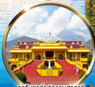
ดาริมซาล่า "ธรรมศาลา" ตำหนักองค์ดาโลลามะ