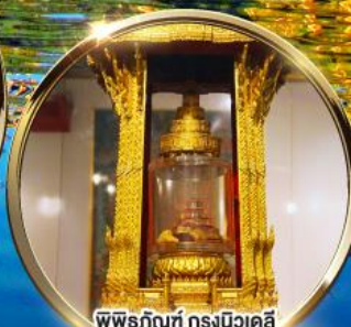
พิพิธภัณฑ์ กรุงนิวเดลี กราบมัสการพระบรมสารีริกธาตุ