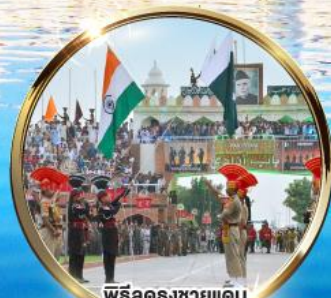
พิธีลดธงชัยแดน อินเดีย-ปากีสถาน ผ่านวาทะ

บินภายในไป-กลับ DEL ATO IXC DEL นั่งรถไม่เหนื่อย