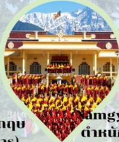
Amgyal Monastery ตำหนักองค์ดาไลลามะ ดาร์มซาล่า