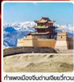
กำแพงเมืองจีนด่านเจียวกวน

• ไซโล่...เส้นทางสายไหม ชมสระบัววังพระจันทร์ ทะเลทรายผิงซาซาน กำแพงเมืองจีนด่านสุดท้าย "เจียวกวน" มรดกโลกภูเขาสายรุ้งจางเย่