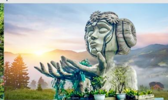
โมอาน่าคาเฟ่

*ทางบริษัทฯ ขอสงวนสิทธิ์ในการสลับโปรแกรมทัวร์ตามความเหมาะสมขึ้นอยู่กับสถานการณ์หน้างาน โดยคำนึงถึงผลประโยชน์ของลูกค้าเป็นสำคัญ