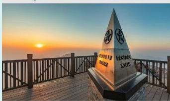
ฟานซิปัน