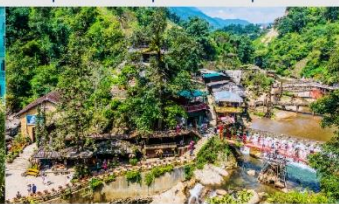
หมู่บ้านก๊ต ก๊ต