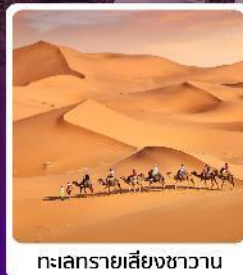
ทะเลทรายสีงาชวาน