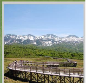
“SHIRETOKO 5 LAKES”