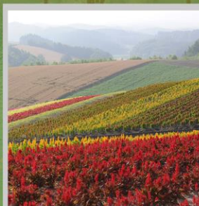
“SHIKISAI NO OKA”