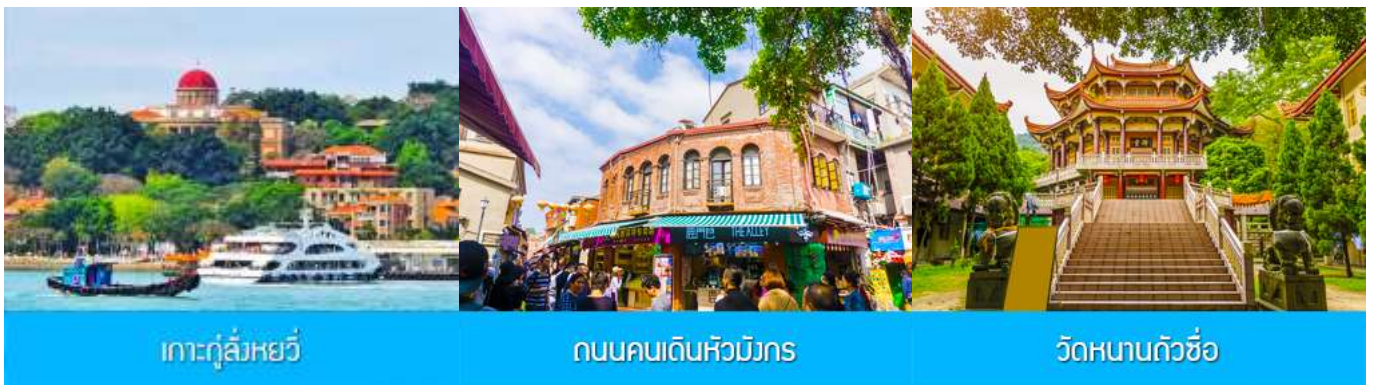
เกาะกู่ลิ่งหยวี

พักที่ โรงแรม XIAMEN HENGLONG HOTEL 4* หรือเทียบเท่าในเซี่ยเหมิน