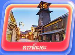
คาวาโตะอะ