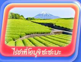
ไร่ชาที่โอบุจิ ชะชะบะ

Highlight สัมผัสความเป็นญี่ปุ่น ชมวิวฟูจิที่ ทะเลสาบยามานา ทะโคะ ศาลเจ้าฟูจิซัง เซนเจน "Unseen" ขอฟรด้วยหัวโซเก้ทำ ที่วัดมัตสึจิยามา ไซเด็น ถ่ายภาพวิวไร่ชาที่ โอบุจิ ชะชะบะ ขอฟร วัดอาซากุสะ วัดพระโศภิตคุ โดบุทสึ เดินเล่น คาวาโตะอะ Toyosu Senkyaku Banrai ซ้อมบิงย่านชินจูกุ และห้างไดเวอร์ซิตี