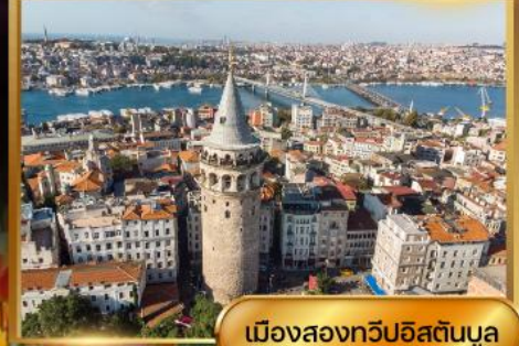
เมืองสองทวีปอิสตันบูล