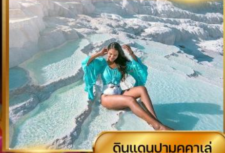
ดินแดนปามุคคาเล่