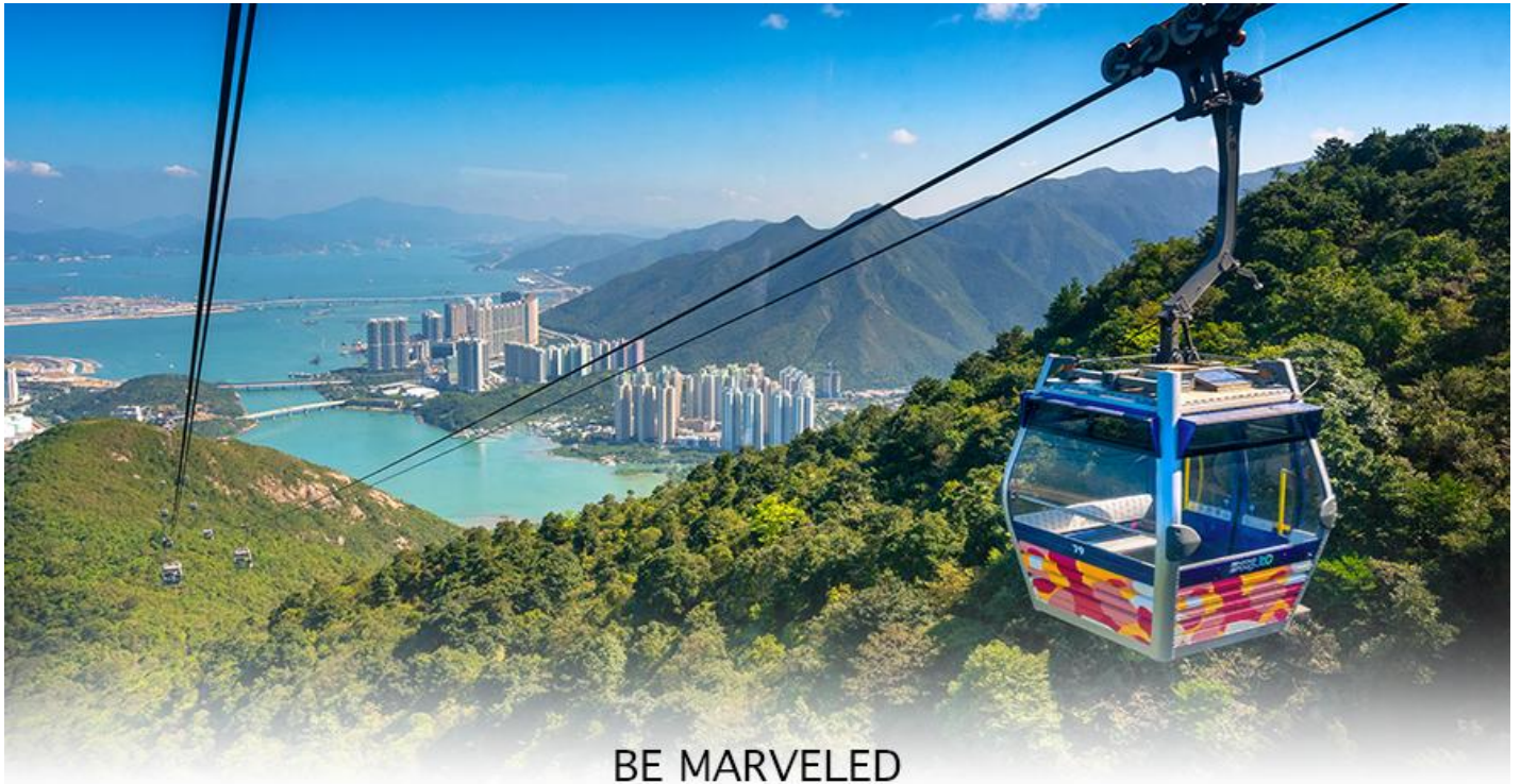
BE MARVELED กระเช้ามองปีง

ของอุทยานบนเกาะลันเตาเหนือ ถือได้ว่าเป็นแหล่งท่องเที่ยวอันมีเอกลักษณ์ระดับโลกของฮ่องกง (**กรณี กระเช้ามองปีง 360 มีการปิดซ่อมบำรุง หรือ มีการปิดเนื่องจากสภาพอากาศแปรปรวน ทางบริษัทฯ ขอสงวน สิทธิ์ในการเปลี่ยนเป็นใช้รถโค้ชของทางอุทยานในการเดินทาง เพื่อนำท่านขึ้นสู่หมู่บ้านวัฒนธรรมมองปีง บน เกาะลันเตาแทน**) จากนั้นนำท่านไปสักการะ (พระใหญ่เกาะลันเตา หรือ พระพุทธรูปเทียนถาน (TIAN TAN BUDDHA STATUE))