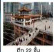
ตึก 22 ชั้น