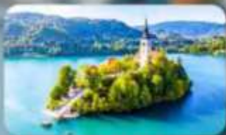
โบสถ์พระแม่มาเรียแห่งบลัด