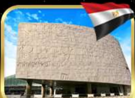
ห้องสมุดอเล็กซานเดรีย