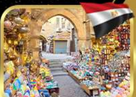
ตลาดชานเอลคาลิลี