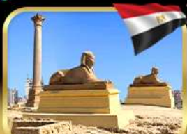
เสาสีมันปอมเปย์