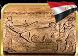
สุสานใต้ดินอเล็กซานเดรีย

เข้าชมพิพิธภัณฑ์อียิปต์แห่งใหม่ (GRAND EGYPTIAN MUSEUM)