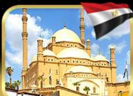
มัสยิดโมฮัมหมัดอาลี