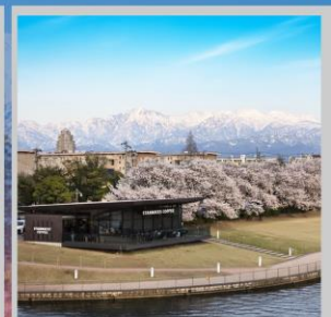
“TOYAMA KANSUI PARK”