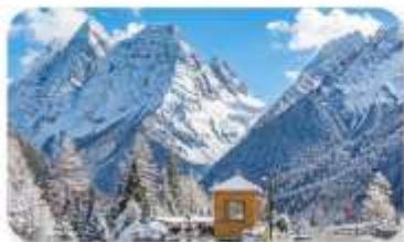
ภูเขาสี่ครุณี