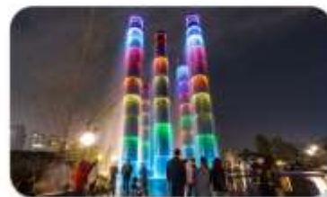
น้ำพุไม้ไผ่