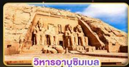
วิหารอาบูซิมเบล

น้ำหนักกระเป๋า 23Kg. (บนระหว่างประเทศ และบินภายใน)