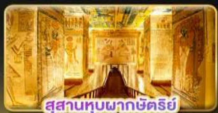
สุสานหุบผากษัตริย์