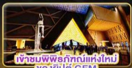
เข้าชมพิพิธภัณฑ์แห่งใหม่ของอียิปต์ GEM