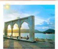
Ana Sagar Lake