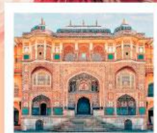
♥♦♦ Amber Fort