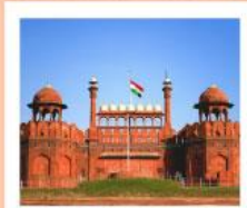
♥♦♦ Agra Fort