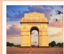
♥♦♦ India Gate