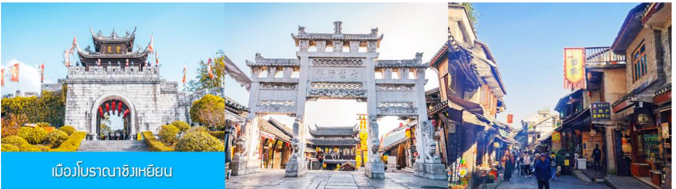
เมืองโบราณชิงเหยียน

เที่ยง รับประทานอาหารกลางวัน ณ ภัตตาคาร (มือที่ 8)