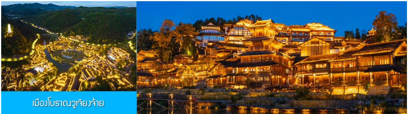
เมืองโบราณวูเจียงจ้าย

หลังอาหารนำท่านเที่ยวชม เมืองโบราณวูเจียงจ้าย 乌江寨景区 เป็นอุทยานท่องเที่ยวริมเมืองโบราณชนเผ่าเหมียว (ชนเผ่าม้ง) ที่ได้ชื่อว่ามีวิวกลางคืนที่สวยงามที่สุดของมณฑลกุ้ยโจว อุทยานนี้รวมไว้ซึ่งแหล่งท่องเที่ยว สถานที่ถ่ายทำภาพยนตร์ ร้านอาหาร รีสอร์ท ศูนย์ประชุม ด้วยทุนสร้างกว่าหมื่นล้านหยวน สัมผัสบ้านเรือนโบราณของชนเผ่าเหมียว ซึ่งเป็นชนกลุ่มหลักที่พำนักในพื้นที่มานาน ปัจจุบันชนเผ่าเหมียวยังคงรักษาไว้ซึ่งขนบธรรมเนียมและวิถีชีวิตแบบดั้งเดิม ชมการแสดงพื้นเมือง และการละเล่นพื้นเมืองของชนกลุ่มน้อยต่างๆ ในช่วงหัวค่ำบ้านทุกหลังในอุทยานจะประดับด้วยแสงไฟที่งดงาม และมีการแสดงต่างๆ อาทิ การบิน โดรน น้ำพุ และการยิงแสงเลเซอร์ ฯลฯ (ค่าทัวร์รวมค่ารถรับส่งภายในเขตอุทยาน ค่าทัวร์ไม่รวมค่านั่งเรือแจวในเขตอุทยาน)