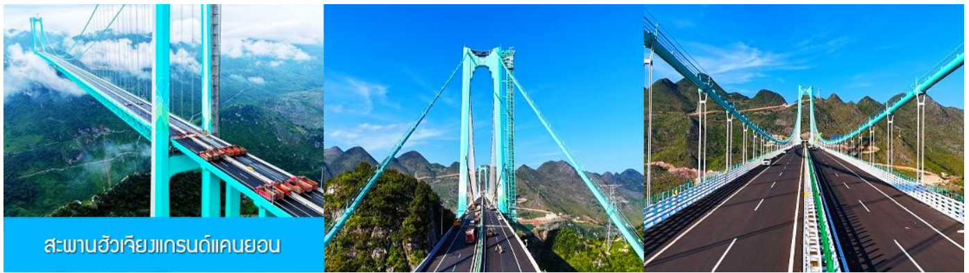
สะพานฮิวเจียงเกรนด์แคนยอน

ไกด์นำเสนอ OPTIONAL TOUR แพคเกจเที่ยวชมตัวสะพาน รวมค่าบัตรนั่งลิฟท์แก้วขึ้นสู่ชั้นชมวิวบนทาวเวอร์ รวมค่ารถรับส่งจากศูนย์บริการนักท่องเที่ยวสู่ตัวสะพาน รวมกาแฟบนหอคอยชมวิวท่านละ 1 แก้ว อัตราค่าบริการ 380 หยวนหรือ 1,900 บาทต่อท่าน