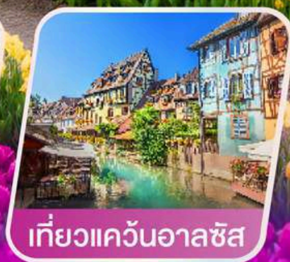
เที่ยวแคว้นอาลซัส