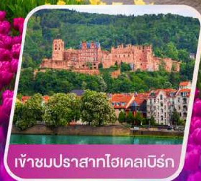
เข้าชมปราสาทไฮเดิลเบิร์ก